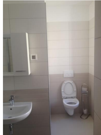
Smještaj za osoblje