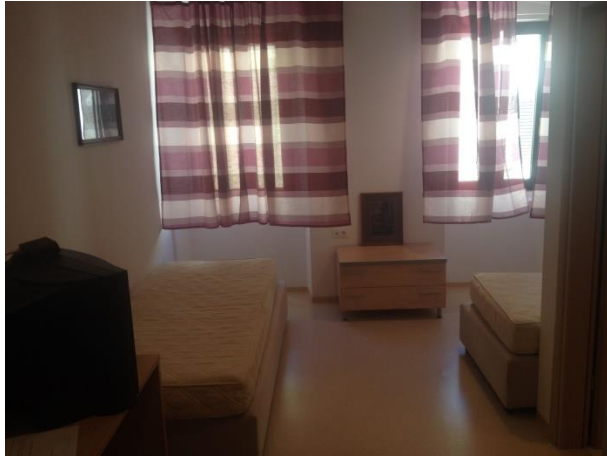
Smještaj za osoblje