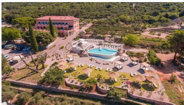
Hotel & Resort Kanajt

MOLBE I ŽIVOTOPISI: Molbe i životopise dostavite poštom ili mailom na : Hotel Kanajt , Kanajt 5 , 51521 Punat vlado.talic@kanajt.hr Nakon primitka molbe u najkraćem roku ćemo Vas kontaktirati oko dogovora za intervju.